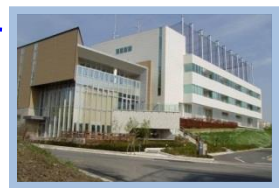
八洲薬品(株) (彩都バイオ ヒルズセンター)