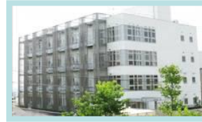
彩都バイオイノ ベーションセンター