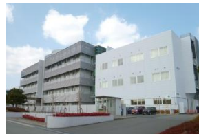
独立行政法人 医薬基盤・健康・ 栄養研究所