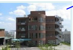
トーヨーポリマー(株)