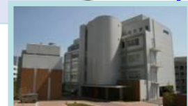
(株)ペプチド研究所