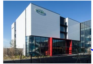
アース環境サービス(株)