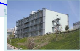
彩都バイオインキュベータ