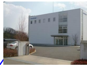
(株)ジーンデザイン