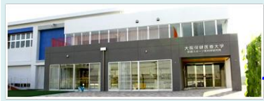
大阪保健医療大学