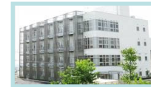
彩都バイオイ ノベーションセンター