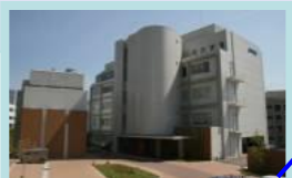
(株)ペプチド研究所