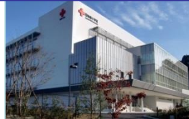
日本赤十字社 近畿ブロック血液センター