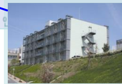
彩都バイオインキュベータ