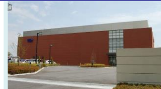
エムジーファーマ(株)