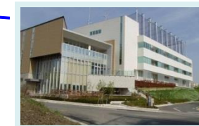
八洲薬品(株) (彩都バイオ ヒルズセンター)