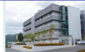
国立研究開発法人 医薬基盤・健康・栄養研究所