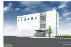
(株)ジーンデザイン