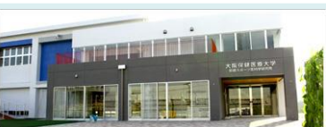
大阪保健医療大学