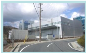
(財)日本品質保証機構