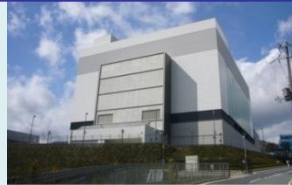
日本生命保険 彩都センター